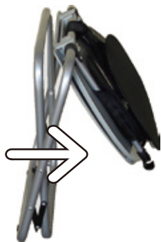
ふた・便座・固定具を押し出します。