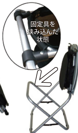
ふた・便座・固定具を前に倒して固定具を前方のパイプに挟み込みます