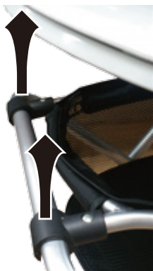
固定具を引き上げてパイプから外します。