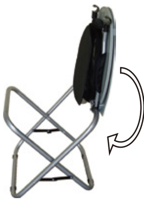
ふた・便座・固定具をまとめて回転させ、下に向けます。