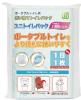
14枚入 2週間パック 参考価格 2,800円