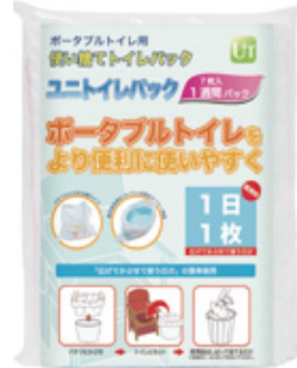
7枚入 1週間パック 参考価格 1,400円