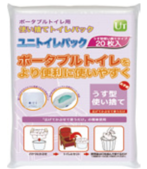
20枚入 参考価格 2,500円