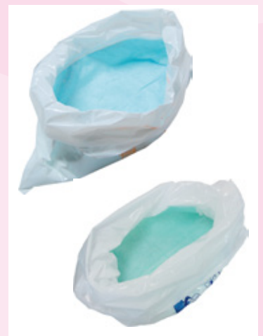
吸水シート一体型