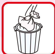
使用後は口を結んで捨てるだけ ※地域のルールに従って処分してください。