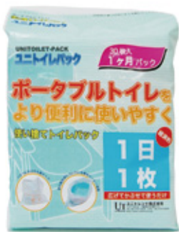
30枚 1ヶ月パック 参考価格 5,400円