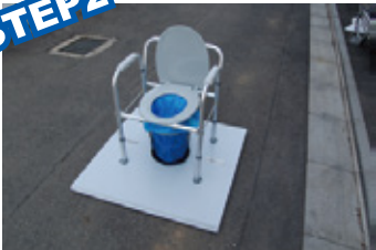
マンホールガイド、ガイドポリを取り付けたトイレ本体を設置します