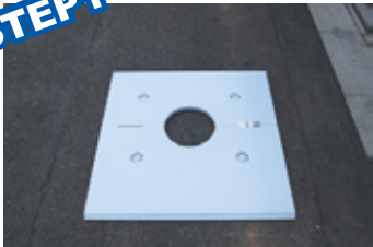
マンホールのふたを開け、プレートをのせます