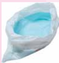
吸水シート一体型